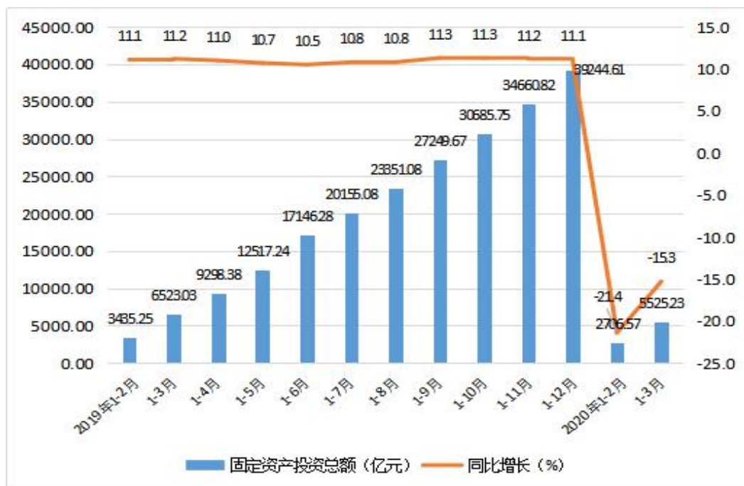
图 3 2019 年以来广东固定资产投资增速图

度来源于国家预算资金增长 22.5%。分区域看，珠三角降幅小于粤东西北 8.3 个百分点；分地市看，梅州、汕尾实现正增长。