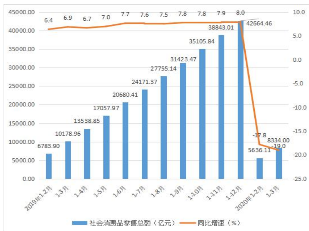
图 4 2019 年以来广东社会消费品零售总额增速图

有 17 个类别增速高于 2 月份。分区域看，一季度，粤东西北降幅小于全省 0.6 个百分点。分地市看，广州、汕尾、东莞等 9 市降幅小于全省平均水平。