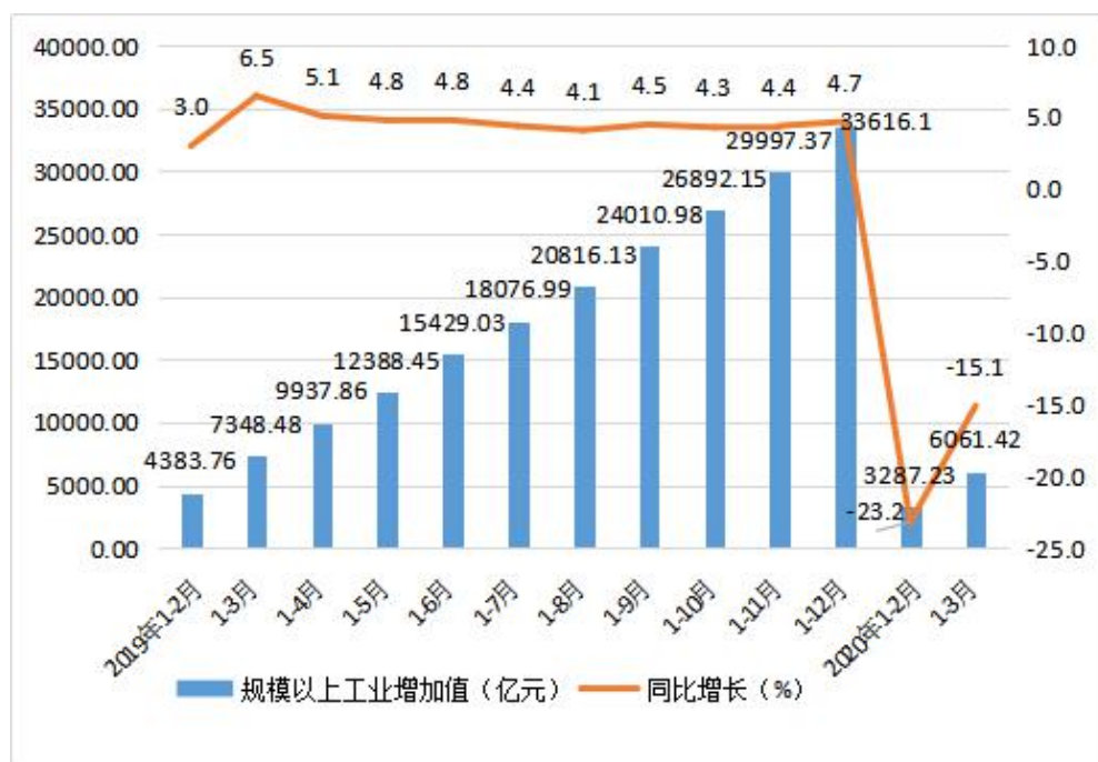
图 2 2019 年以来广东规模以上工业增加值增速图

疗仪器设备及器械制造增长 13.6%。防疫物资及高技术产品增势良好，医用口罩、发酵酒精产量分别增长 18.5 倍和 33.8%。