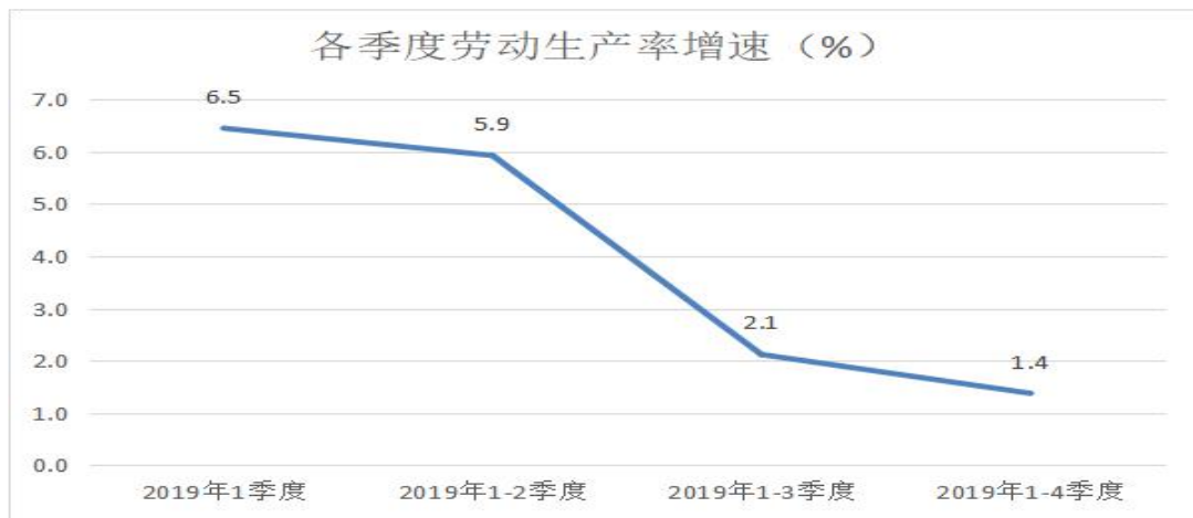
图3 2019年各季度劳动生产率增速

(三) 建筑劳务用工市场供需不平衡，“招工难、用工难”问题凸显。近几年，广东建筑业实现了快速增长，带动劳动力需求逐年增长。同时，建筑业行业吸引力低，80后、90后等新生代农民工大多对工作环境要求较高，往往不愿从事辛苦繁重的建筑行业，供需不平衡导致建筑劳务用工市场长期供小于求。对建筑业企业而言，不仅一线熟练技工紧缺，普通的木工、架子工、瓦工、混凝土工等也很难稳定，建筑业普遍面临人难招，人工成本高的压力。